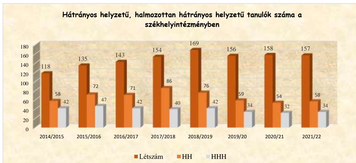
1. számú ábra: Hátrányos helyzetű tanulók a székhelyintézményben

A következő diagram a hátrányos és halmozottan hátrányos tanulók arányát mutatja a székhelyintézményben 8 tanévre visszamenőleg.