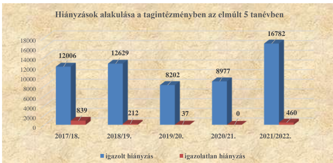
Hiányzások alakulása a tagintézményben

A korábbi évekhez viszonyítva a 2021/2022-es tanévben nagymértékben emelkedett a mulasztott órák száma, mely a tagintézményben összesen 17 242 óra , ebből 460 óra igazolatlan volt . A magas mulasztást a Covid-járvány miatti megbetegedések, illetve a szülők aggodalma okozta, a legkisebb betegség jelére is már otthon marasztalták a gyermekeket, vagy esetleg az orvossal való kontakthiányt kihasználva maradtak otthon a tanulók. A 2021/22-es tanév második félévében az igazolatlan mulasztással érintett tanuló 5 fő volt . A tanulói hiányzások csökkentése érdekében folyamatosan értesítést küldtünk a gondviselőknek (27 esetben), személyes családlátogatás keretében is